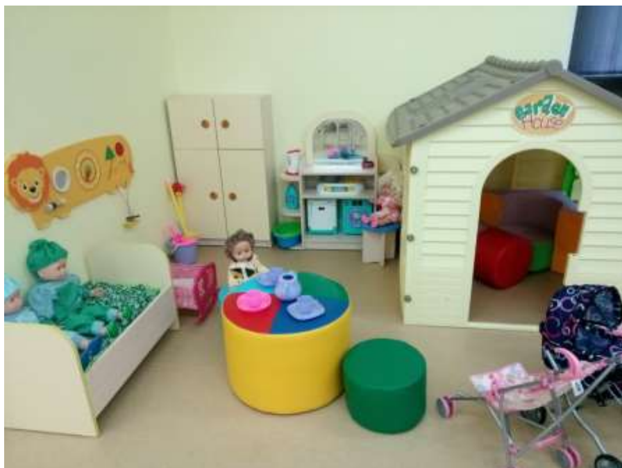
ОО «Познавательное развитие» Сенсорное развитие