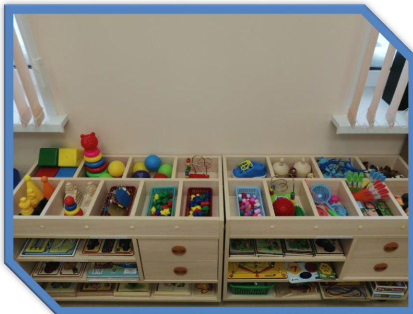
Центр развития элементарных математических представлений