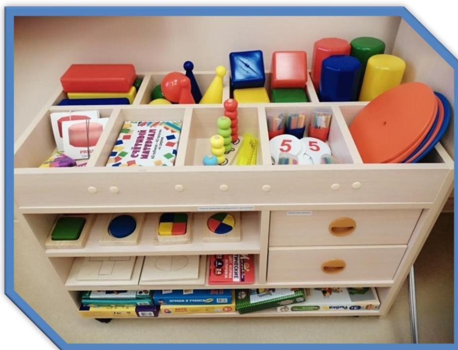
Центр ознакомления с окружающим миром и развития речи, основных психических процессов (внимание, память, мышление) и развития разных видов деятельности