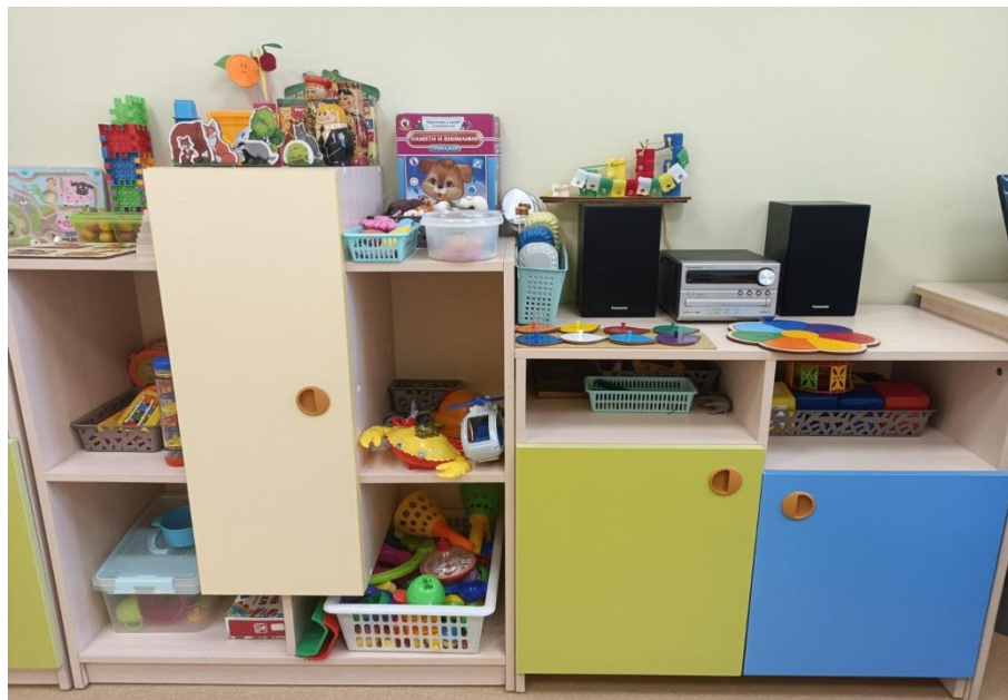
ЗОНА СЕНСОРНОГО РАЗВИТИЯ И РАЗВИТИЯ ВЫСШИХ ПСИХИЧЕСКИХ ФУНКЦИЙ