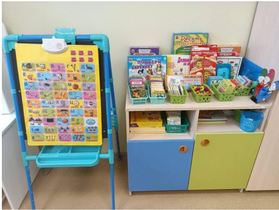
ЗОНА ОБУЧЕНИЯ ГРАМОТЕ, КОРРЕКЦИИ ЛЕКСИКО- ГРАММАТИЧЕСКОГО СТРОЯ РЕЧИ